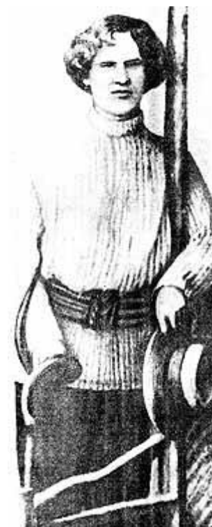
Василий Яковлевич Ерошенко 12.01.1890 (по ст. стилю 31.12.1889) – 23. 12.1952

По воспоминаниям местных жителей, у могучего дерева - старца любил бывать, творить слепой писатель, наш земляк, человек - мира Василий Яковлевич Ерошенко. Он подолгу отдыхал под роскошной кроной, наслаждаясь прохладой, заряжаясь энергией и мощью этого священного дерева.